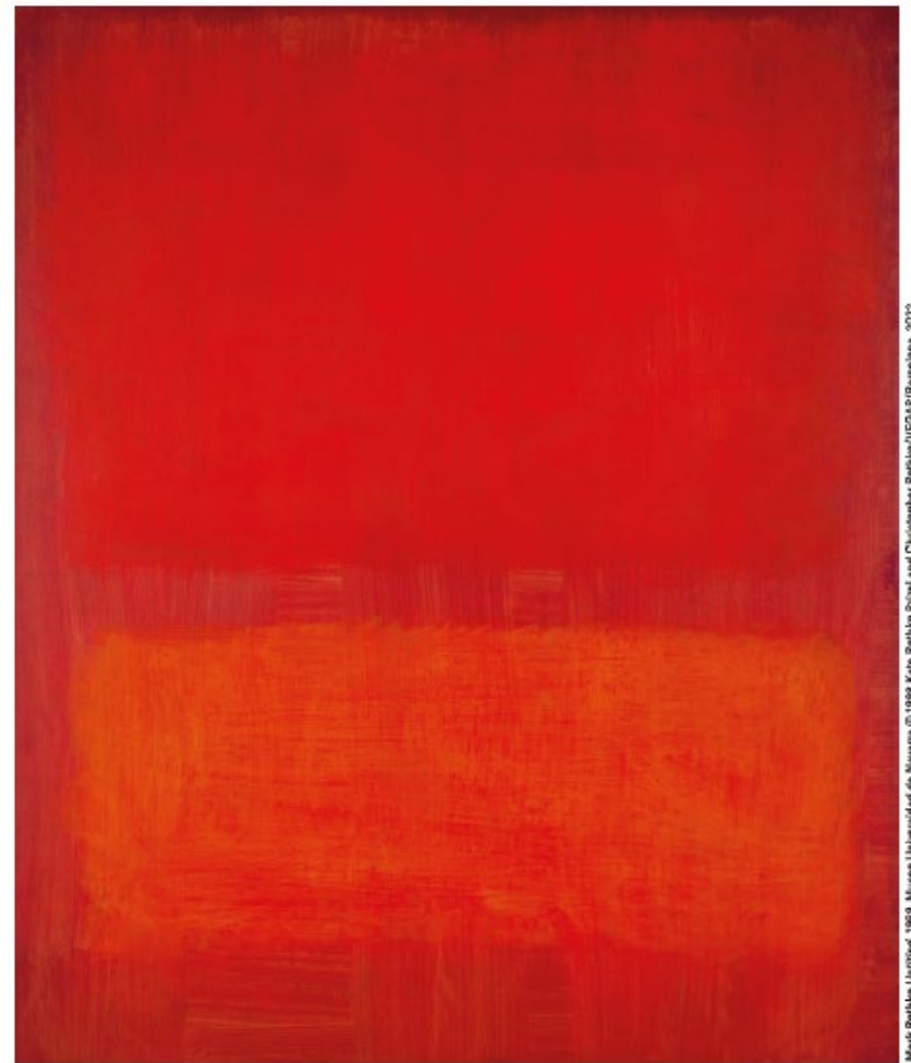
Mark Rothko, Untitled, 1963. Museo Universidad de Navarra.

Diàlegs amb el Museo de Arte Abstracto Español de Conca