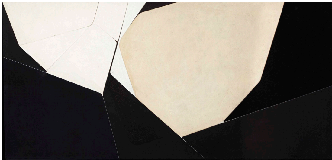
Pablo PALAZUELO Omphale V , 1965-1967 Col·lecció Fundación Juan March, Museo de Arte Abstracto Español, Conca

La Fundació Catalunya La Pedrera presenta una important exposició, organitzada en col·laboració amb la Fundación Juan March , que fa una revisió del moviment de l'abstracció a Espanya entre els anys 1957 i 1978, en diàleg amb els corrents artístics europeus i americans d'aquest període.