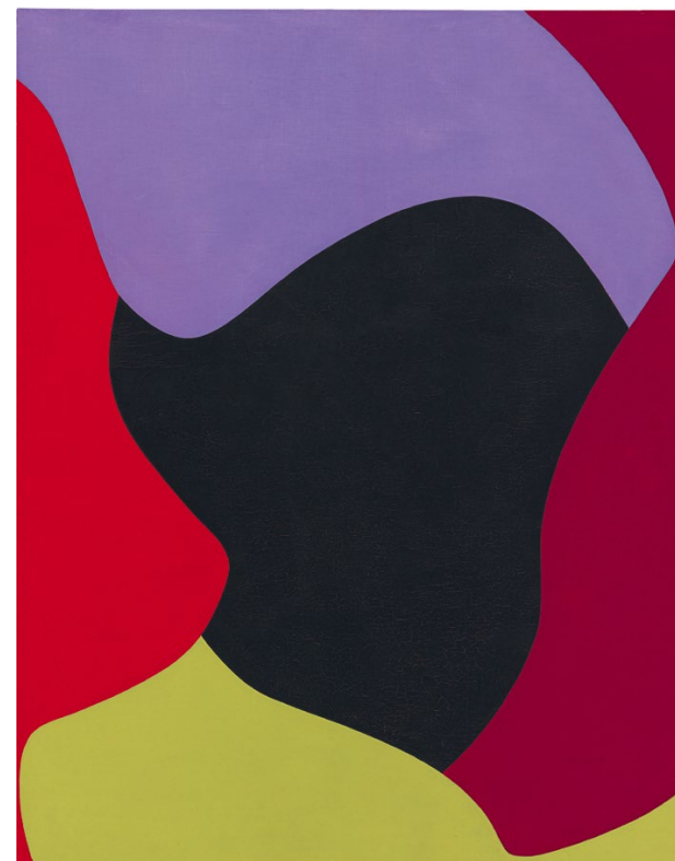
EQUIPO 57 PA-8, 1959 Col·lecció Fundación Juan March, Museo Fundación Juan March, Palma

L'exposició «Els camins de l'abstracció, 1957-1978. Diàlegs amb el Museo de Arte Abstracto Español de Conca», concebuda i organitzada per la Fundació Catalunya La Pedrera i la Fundación Juan March, a més de posar en relleu la gènesi del primer museu de l'abstracció a Espanya, presenta una selecció important d'obres de la seva col·lecció juntament amb altres d'artistes nacionals i internacionals prestades per diversos museus i col·leccions particulars.