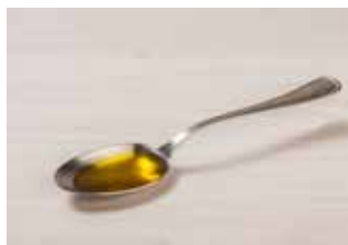
1 cucharada sopera de aceite de oliva virgen