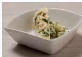
25 g de queso roquefort o azul