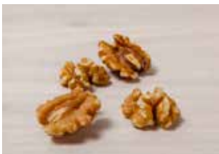
4 medias nueces peladas