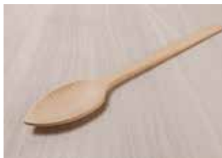
Cuchara de madera