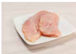
1 pechuga de pollo en filetes