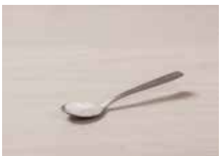
1 cucharilla de sal