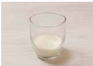
Un tercio de vaso de nata líquida