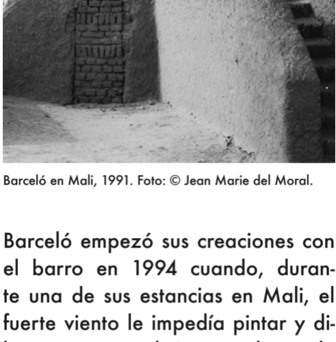
Barceló en Mali, 1991.

Se formó en la Escuela de Artes y Oficios de Palma antes de ser admitido en la Escuela de Bellas Artes de Sant Jordi de Barcelona, que abandonó poco después. Empezó a exponer a mediados de los años setenta y pronto logró un amplio reconocimiento internacional, en el contexto de la eclosión de los nuevos expresionismos, tras participar en la Bienal de São Paulo (1981) y en la Documenta 7 de Kassel (1982). Barceló es conocido, sobre todo, por sus pinturas, ricas en texturas y de gran formato, con imágenes que surgen de la propia viscosidad de la materia. Su obra, de una gran intensidad visceral y al mismo tiempo profundamente reflexiva, emana referencias culturales, desde las pinturas rupestres hasta el arte contemporáneo, e incorpora y recrea temática y físicamente la materia, la vida orgánica y el tiempo.