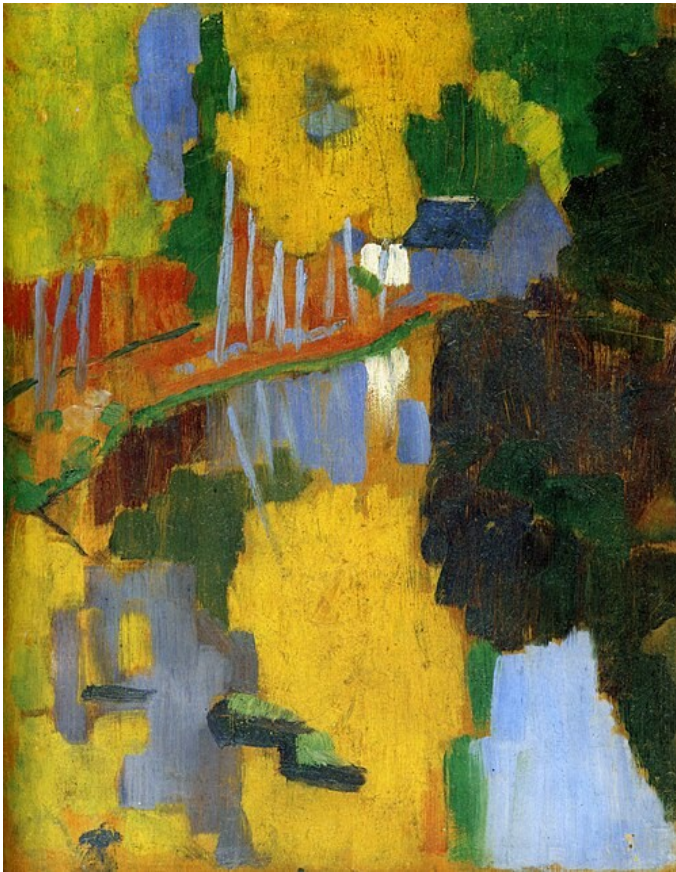
Paul Sérusier, Le talisman. Paysage au bois d'Amour , 1888 Musée d'Orsay, Paris