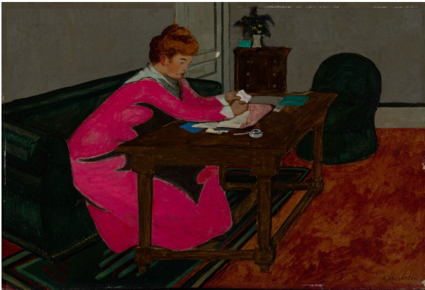
Félix Vallotton, Misia à son bureau , ca. 1897.

En la pintura dels nabís, l'àmbit domèstic es un espai tradicional lligat a les feines casolanes, com tenir cura dels infants o la costura.