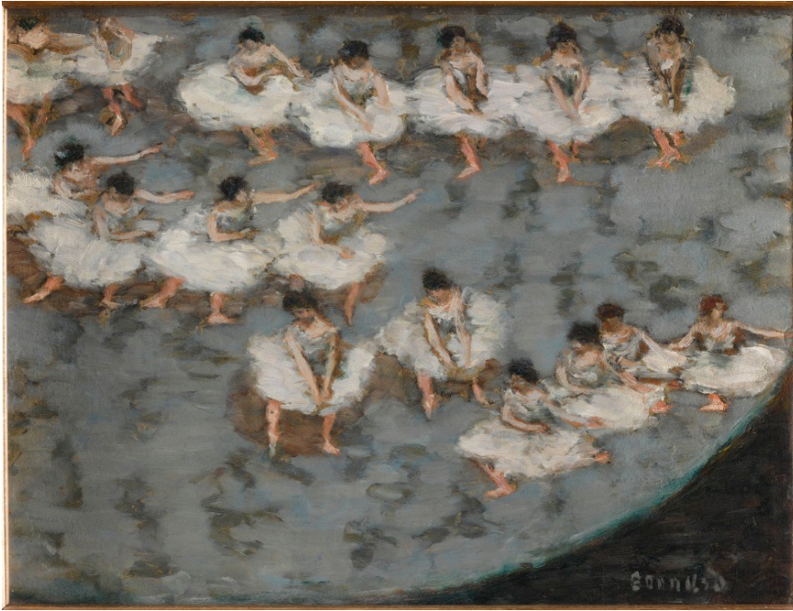
Pierre Bonnard , Danseuses , ca. 1896, Musée d'Orsay, París

L'exposició presenta un conjunt important d'obres realitzades per un grup d'artistes actius a França entre 1888 i 1900.