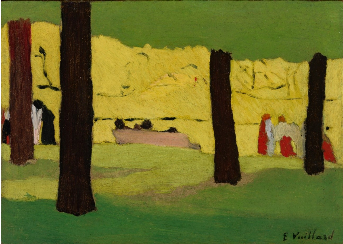
Édouard Vuillard, Le banc rose , 1890, Col·lecció particular