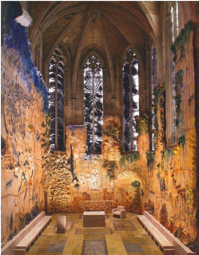
Capilla del Santísimo de la catedral de Mallorca. Foto: Agustí Torres.

Barceló también diseñó las vidrieras de la capilla. En este ámbito podemos ver algunos estudios preparatorios para este trabajo.