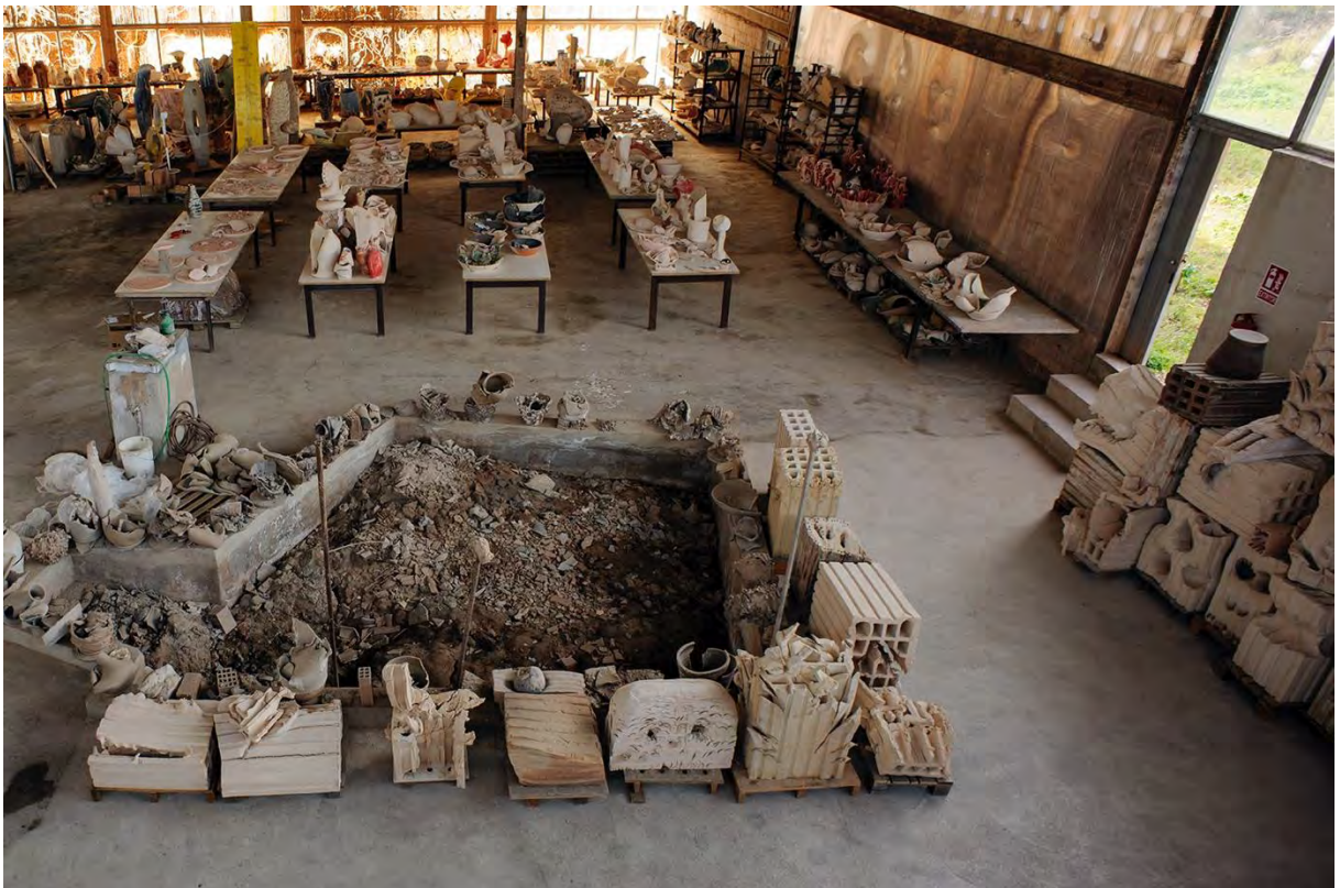
Taller de Vilafranca de Bonany, Mallorca.

Barceló ha realizado ya cerca de cuatro mil cerámicas. Es uno de los artistas más destacados en este medio artístico, que también interesó a Picasso y a Miró.