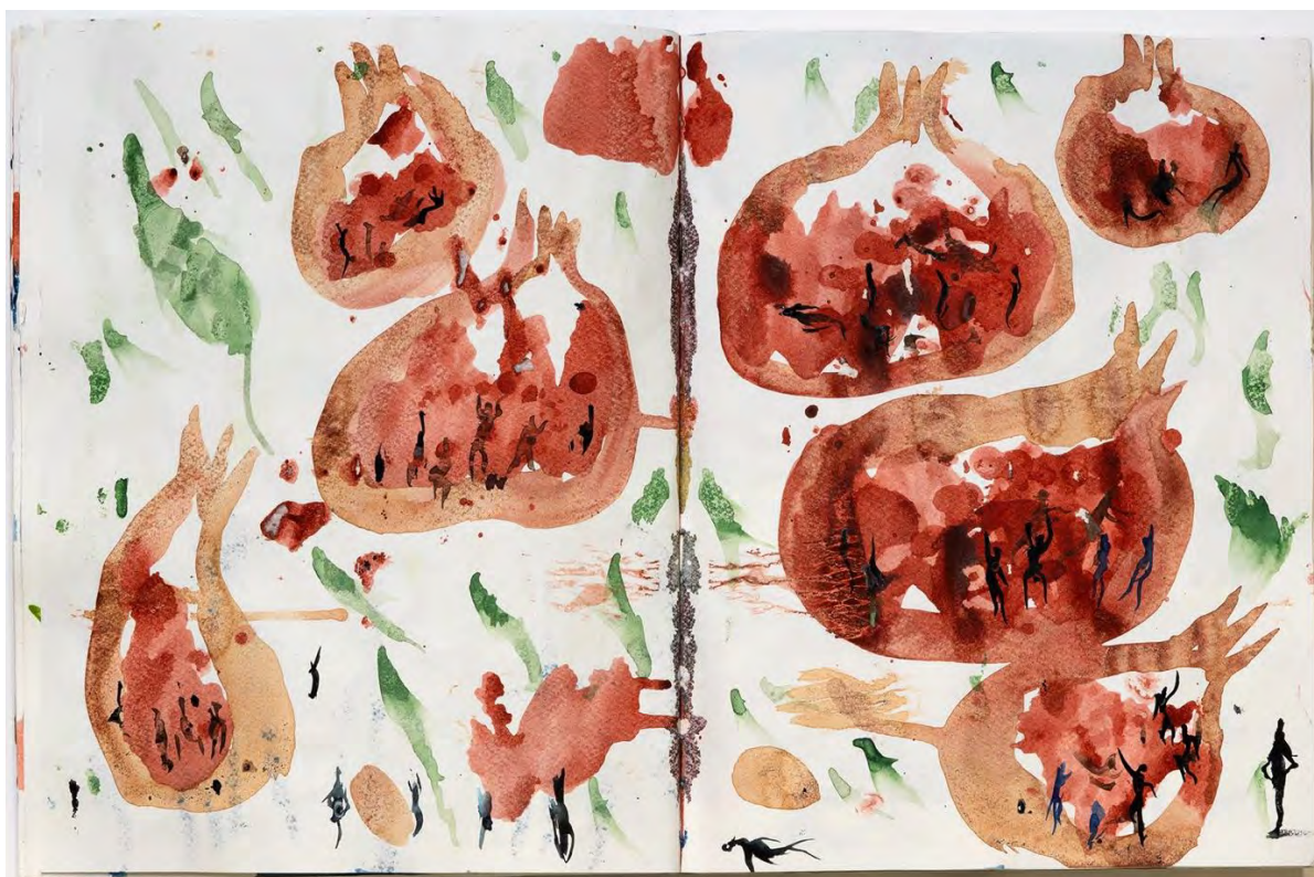
Cuaderno, julio-agosto 2021. Grècia, Artà (Mallorca). © Miquel Barceló, VEGAP, Barcelona, 2024.

En este ámbito se exponen los cuadernos que incluyen referencias directas a su obra en cerámica. Están realizados en lugares tan distintos como Mallorca, Grecia o el Japón.