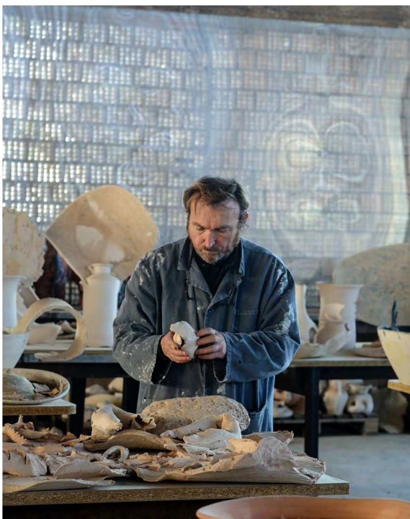
Barceló trabajando en su taller de Vilafranca de Bonany, Mallorca, 2024.

En 2001 comienza a trabajar en un taller en la población italiana de Vietri sul Mare, cerca de Nápoles (Italia).