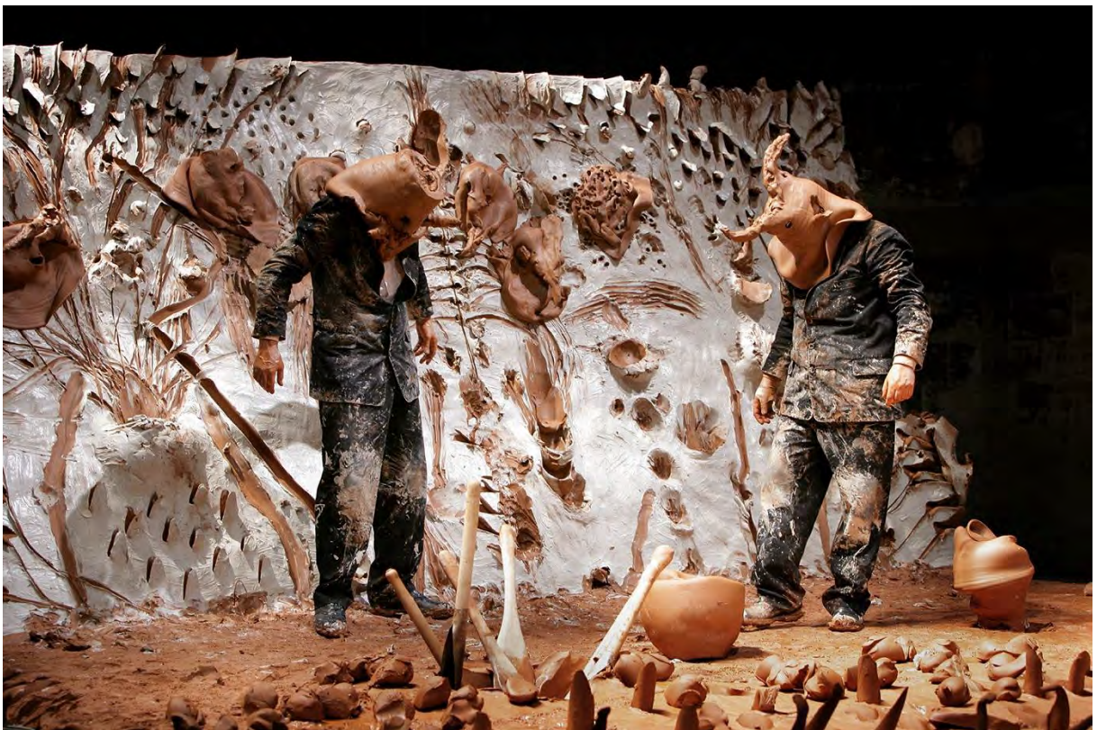
Fotograma extraído de la filmación de Agustí Torres de la representación en el Festival de Avignon, del 16 al 27 de julio de 2006. © Miquel Barceló, VEGAP, Barcelona, 2024.

El proyecto fue muy bien recibido tanto por el público como por la crítica. Se representó en muchas ciudades, de Venecia a Nueva York, pasando por Barcelona y el País Dogón.